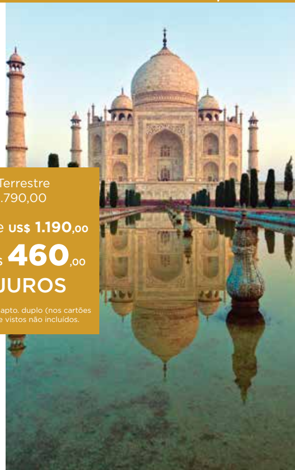
Taj Mahal, Agra

Preço por pessoa em apto. duplo (nos cartões de crédito), taxas e vistos não incluídos.